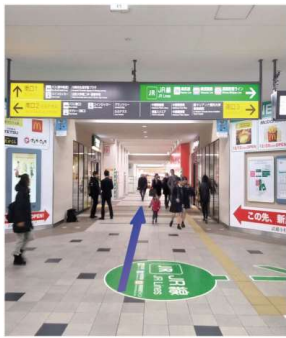
①東横線 武蔵小杉駅 南改札を出て直進します(南口1に向かいます)。