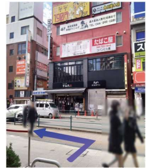
④南口1を出て歩道を左に曲がり直進します。