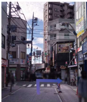
⑨武蔵小杉駅入口の信号を右に曲がります。