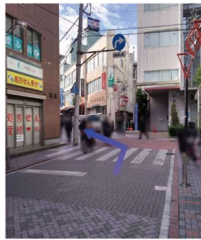
⑦突き当りに聖マリアンナ医科大学東横病院があります。そこを左に曲がります。