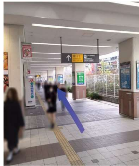
③そのまま直進します。