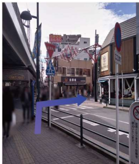
⑤横断歩道を右に曲がります。