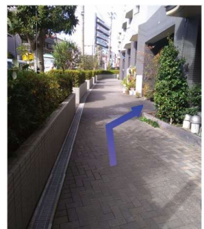
⑫建物の歩道を歩きます。