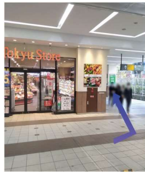
②突き当りの東急ストアのところで、矢印の方向に進みます。