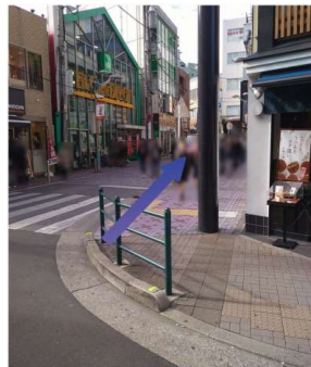
⑥そのまま直進します。