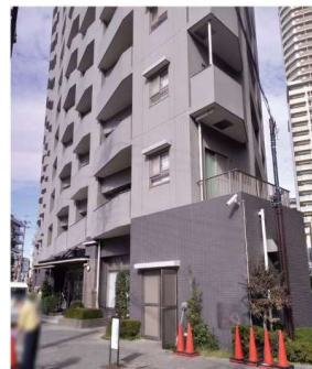
⑪この建物の1階がころと痛みクリニックです。