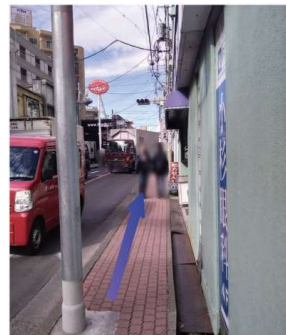
⑩そのまま直進します。