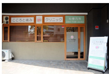
⑬ころと痛みクリニックの入口です。